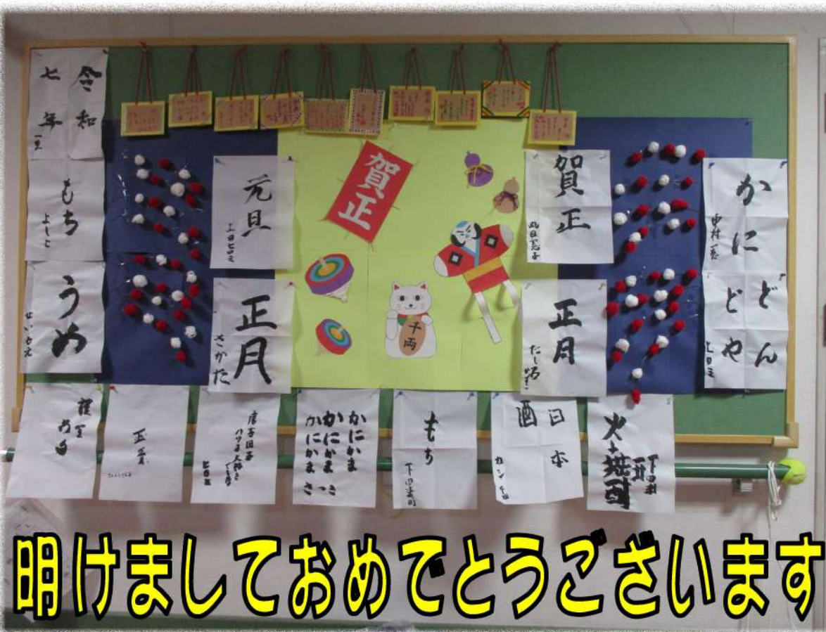
明けましておめでどうございます